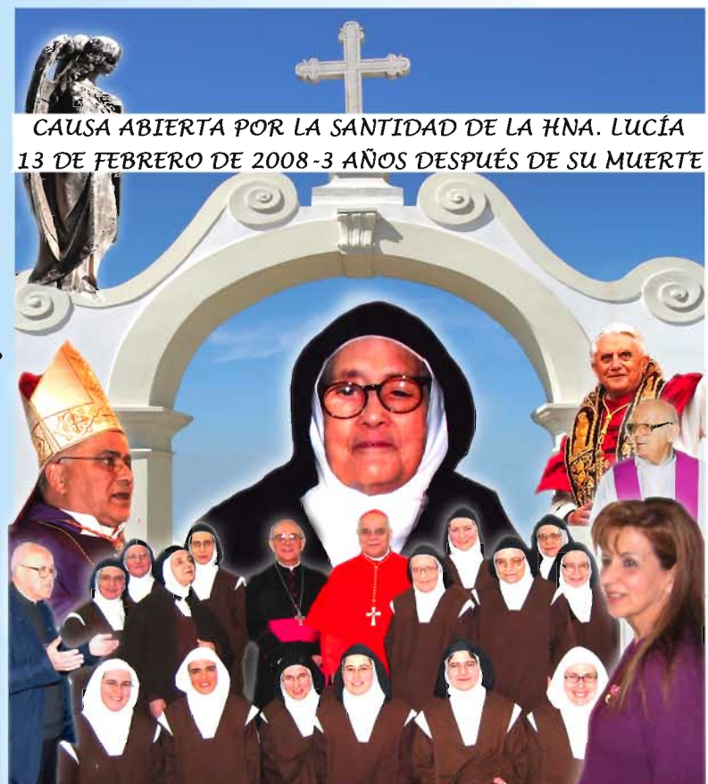
13 de febrero de 2008